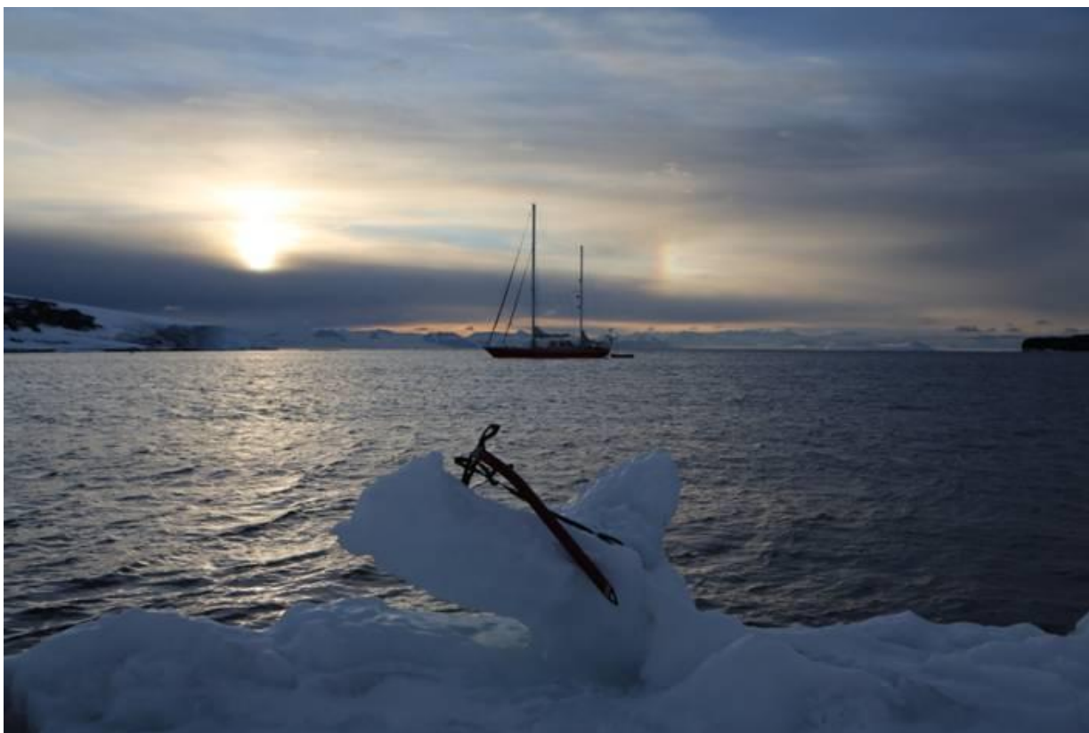
Selma w Backdoor Bay

22.02.2015 r. - dobę po zdobyciu antarktycznego wulkanu Erebus (3,794 m) 6-cio osobowy "Zespół Górski" powrócił na jacht - czekający pod opieką "Zespołu Morskiego" w zatoce Backdoor Bay przy wyspie Rossa.